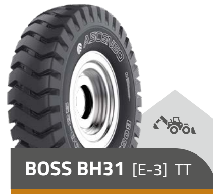
BOSS BH31 [E-3] TT