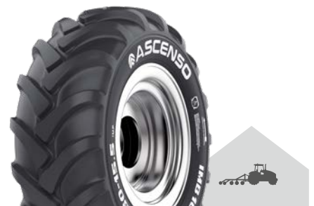
IMB 166 [IMP] TL