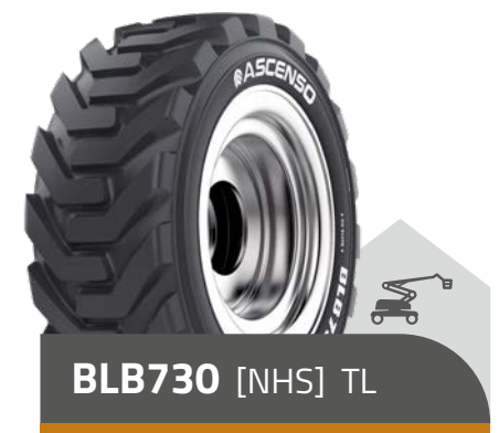
BLB730 [NHS] TL

26x12D - 380 8 PR 315/55D - 20 12 PR 385/65D - 22.5 (15-22.5) 16 PR 445/65D - 22.5 (18-22.5) 18 PR 355/55D - 625 14 PR 15 - 625 16 PR 18 - 625 16 PR 445/50D - 710 18 PR