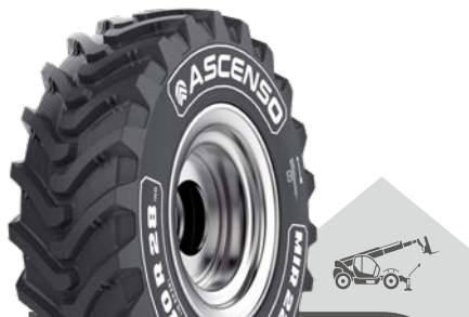
MIR 220 [R-4] TL