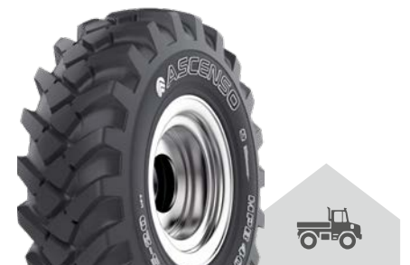
MPB 400 [R-4] TL