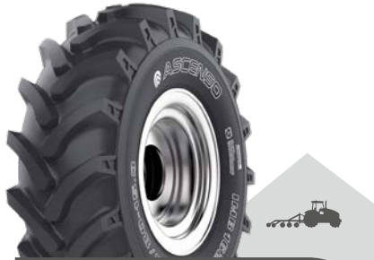
IMB 162 [R-1] TL

Implementreifen für Anhänger Hoflader, Spezialtraktoren, Beregnung und Bodenbearbeitung