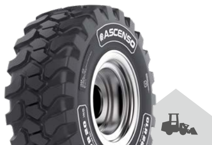
CLR 280 [R-4] TL