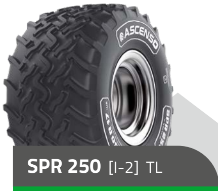
SPR 250 [I-2] TL

31 x 15.50 R 15 122 B 33 x 15.50 R 15 126 B 380/55 R 17 125A8/138A8 425/55 R 17 134 D 500/50 R 17 145 D STB