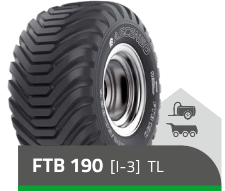
FTB 190 [I-3] TL

Niederdruckreifen für gezogene Fahrzeuge