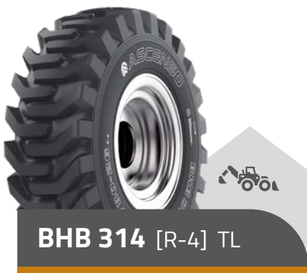
BHB 314 [R-4] TL