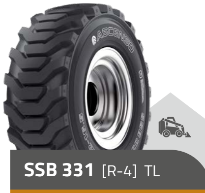
SSB 331 [R-4] TL

10 - 16.5 8 PR | 10 PR 12 - 16.5 10 PR | 12 PR | 14 PR