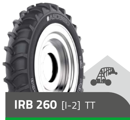
IRB 260 [I-2] TT

11.2 - 24 6 PR 14.9 - 24 8 PR 11.2 - 38 6 PR