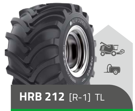
HRB 212 [R-1] TL

Reifen für die Lenkachse von Erntemaschinen und gezogene Anwendungen