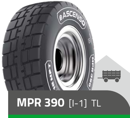
MPR 390 [I-1] TL