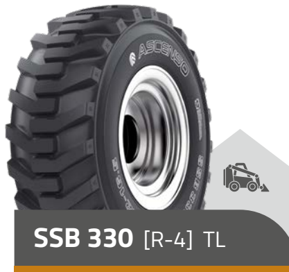
SSB 330 [R-4] TL

Reifen für Skid-Steer Lader und mobile Arbeitsbühnen