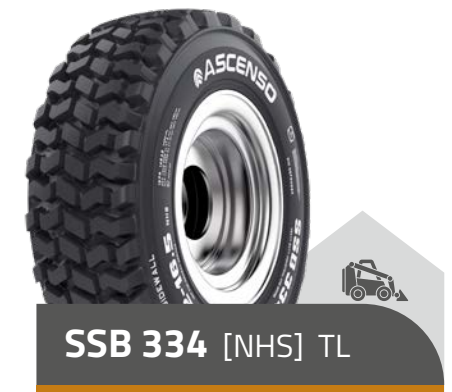
SSB 334 [NHS] TL