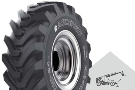
MIB 407 [R-4] TL

Multifunktionaler Reifen für Radlader, Baggerlader und Teleskoplader