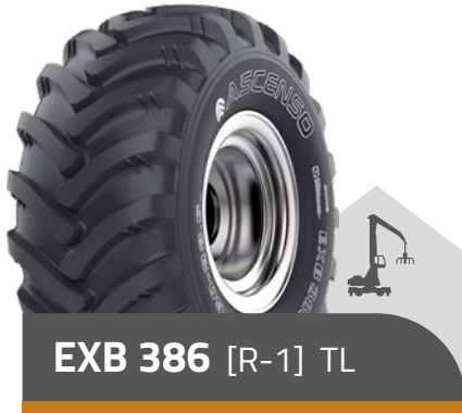
EXB 386 [R-1] TL

340/80-20 (12.5-20) 12 PR TL 360/80-20 (14.5-20) 14 PR TL 400/70-20 (16.0/70-20) 14 PR | 18 PR TL