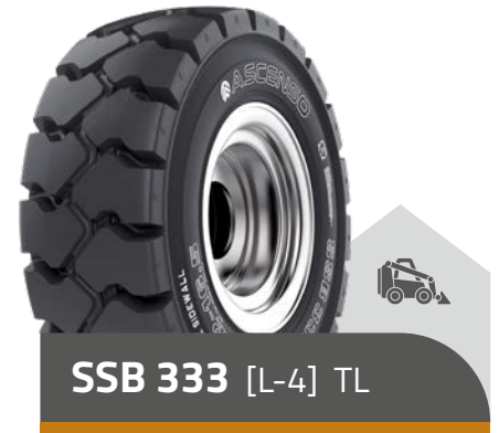
SSB 333 [L-4] TL

10 - 16.5 10 PR 12 - 16.5 12 PR 14 - 19.5 14 PR