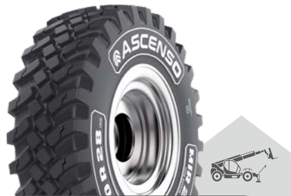
MIR 221 [R-4] TL