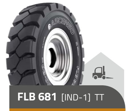
FLB 681 [IND-1] TT