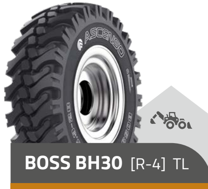
BOSS BH30 [R-4] TL