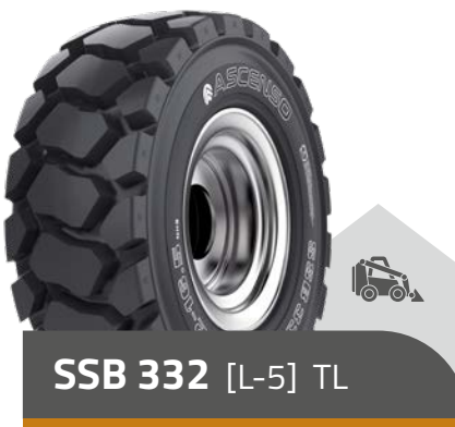
SSB 332 [L-5] TL

23 x 8.50 - 12 8 PR 26 x 12.00 - 12 12 PR 27 x 10 - 12 14 PR 23 x 8.50 - 14 6 PR 25 x 8.50 - 14 6 PR 27 x 8.50 - 15 8 PR 27 x 10.50 - 15 8 PR 31 x 15.50 - 15 10 PR 10 - 16.5 8 PR | 10 PR 12 - 16.5 10 PR | 12 PR | 14 PR 33 x 15.50 - 15 12 PR 33 x 15.50 - 16.5 12 PR 14 - 17.5 14 PR 15 - 19.5 14 PR