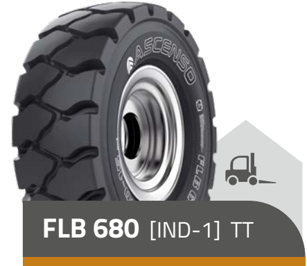
FLB 680 [IND-1] TT