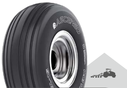
IMB 163 [I-1] TL