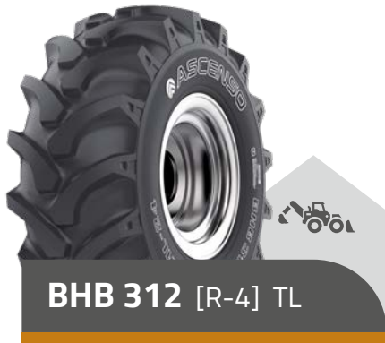
BHB 312 [R-4] TL