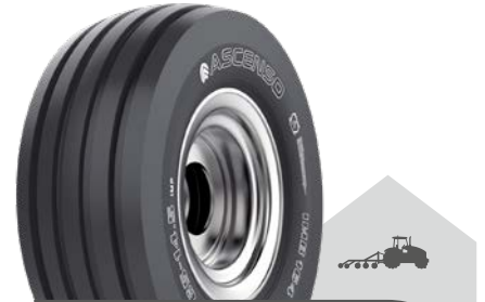
IMB 164 [I-2] TT (TL)