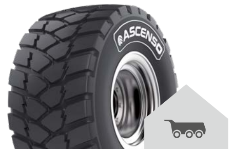
FCR 185 [CON] TL