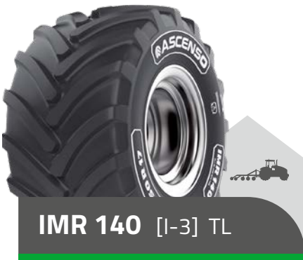
IMR 140 [I-3] TL

31 x 15.50 R 15 122 B 33 x 15.50 R 15 126 B 380/55 R 17 125A8/138A8 425/55 R 17 134 D 500/50 R 17 145 D STB