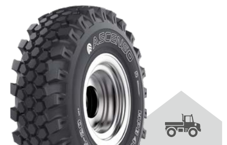
MPB 401 [R-4] TL