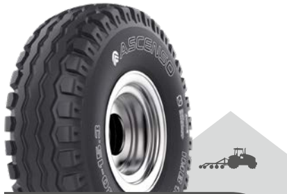
IMB 160 [I-2] TL

Implementreifen für vielseitige Einsatzmöglichkeiten