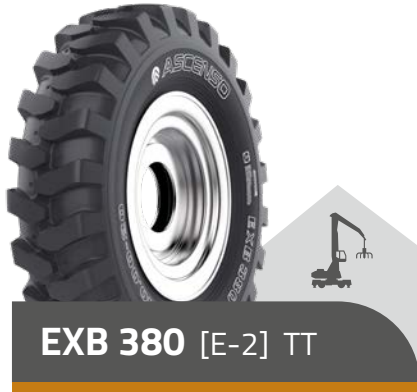
EXB 380 [E-2] TT

8.25 - 20 14 PR TT | SET 9.00 - 20 14 PR TT | SET 10.00 - 20 16 PR TT | SET 11.00 - 20 16 PR TT | SET