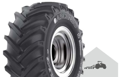
IMB 165 [R-1] TL