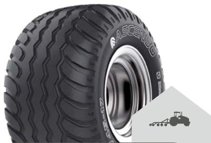
IMB 161 [I-2] TL