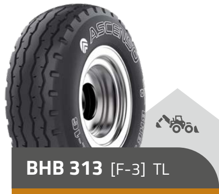
BHB 313 [F-3] TL